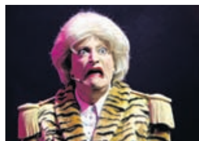
Giftig. Madame Porchet schimpft über die Deutschschweizer.